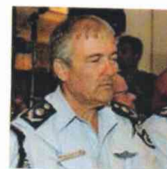
המפכ"ל היוצא דודי כהן

במאי 2008 הובילו גודוהוב ומפקדה פורץ, אייל פרץ, לתחנת המשטרה. בשלב מסוים בשל אירועים נוספים בגזרה נותרו השוטרת ועזיר לבדם, כשהאחרון הצליח להשתלט עליה למרות היותו אזוק. פרץ גנב את אקדחה גרר אותה לעבר רכב משטרה, דרש ממנה לשחררו מהאזיקים, והורה לה לנהוג ברכב כשהוא ישוב מאחוריה ומצמיד אקדח לרקתה. בתום מרדף הוא טרה ונהרג על ידי משטרה וגודוהוב נפצעה.