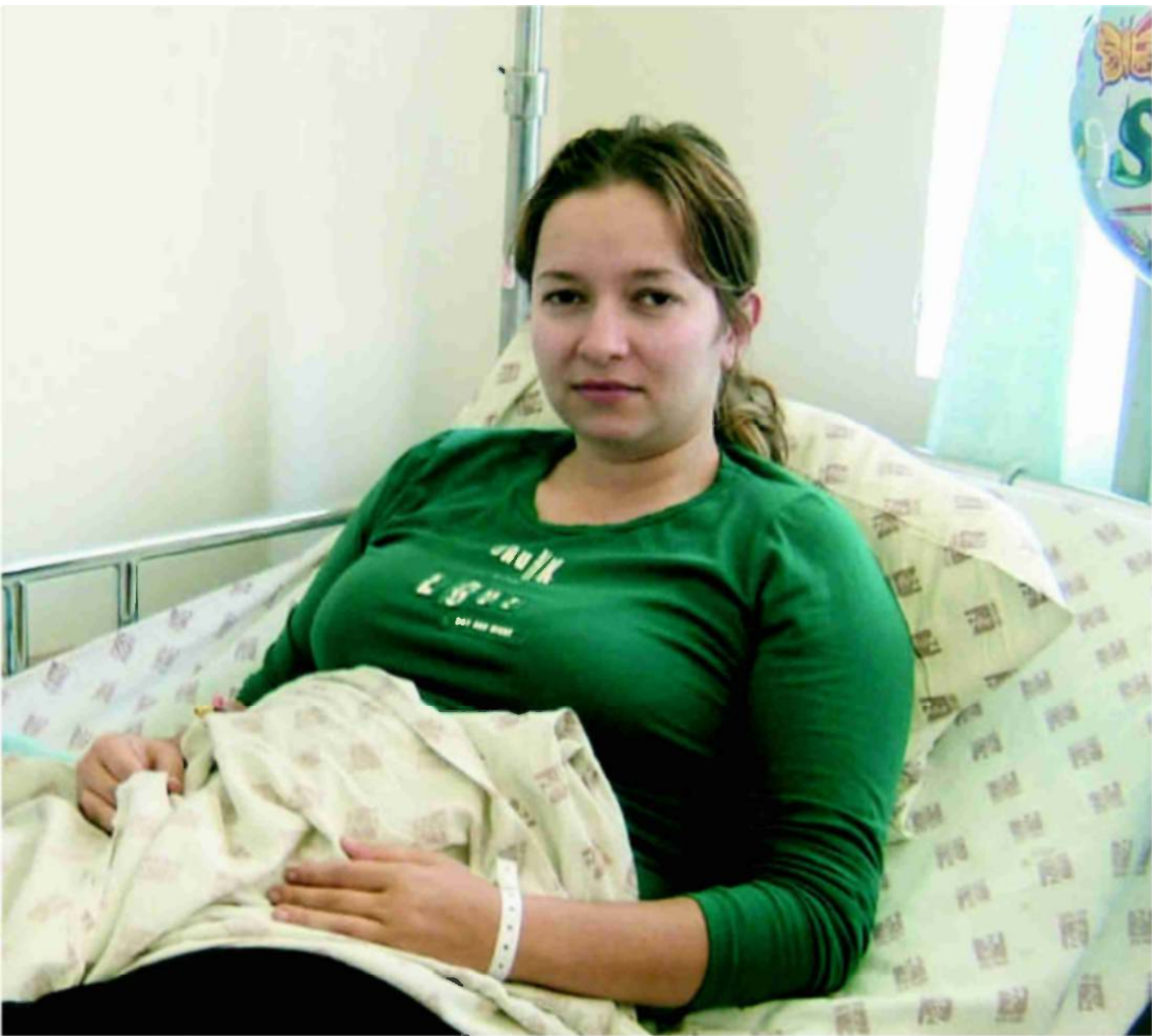
גורחוד. מחכה להחלטת בית הדין לעבודה

מעבר לפגיעה בעצמאותו הכלכלית, בעתידו התעסוקתי ובדימויו העצמי של כל מפוטר, הרי שלפיטוריו של שוטר מתלווית טלטלה משמעותית באשר לדרך בה הוא נתפס על ידי החברה והבריות. הכאב והפגיעה הנלווים לפשיטת המדים ולעזיבת שורות המשטרה שלא מרצון גובים מחיר כבד מהשוטר המפוטר."